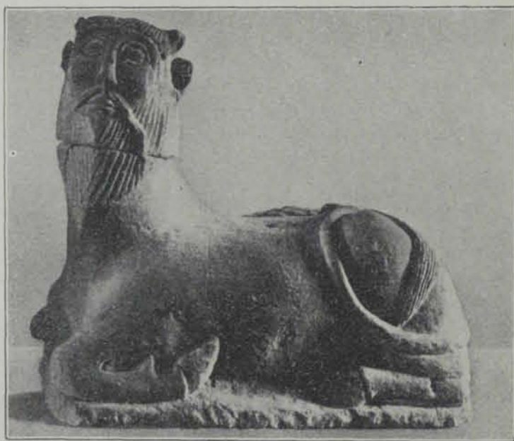
Fig. 9. — Bicha de Bazalote (P. Paris)

Desde que es van tenint coneixements clars de l'importancia y difusió de l'art prehelènic, l'origen de algunes formes